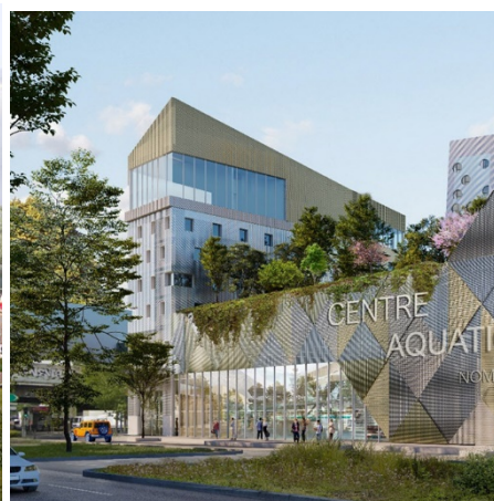
ZAC du quartier durable de la Plaine de l'Ourcq